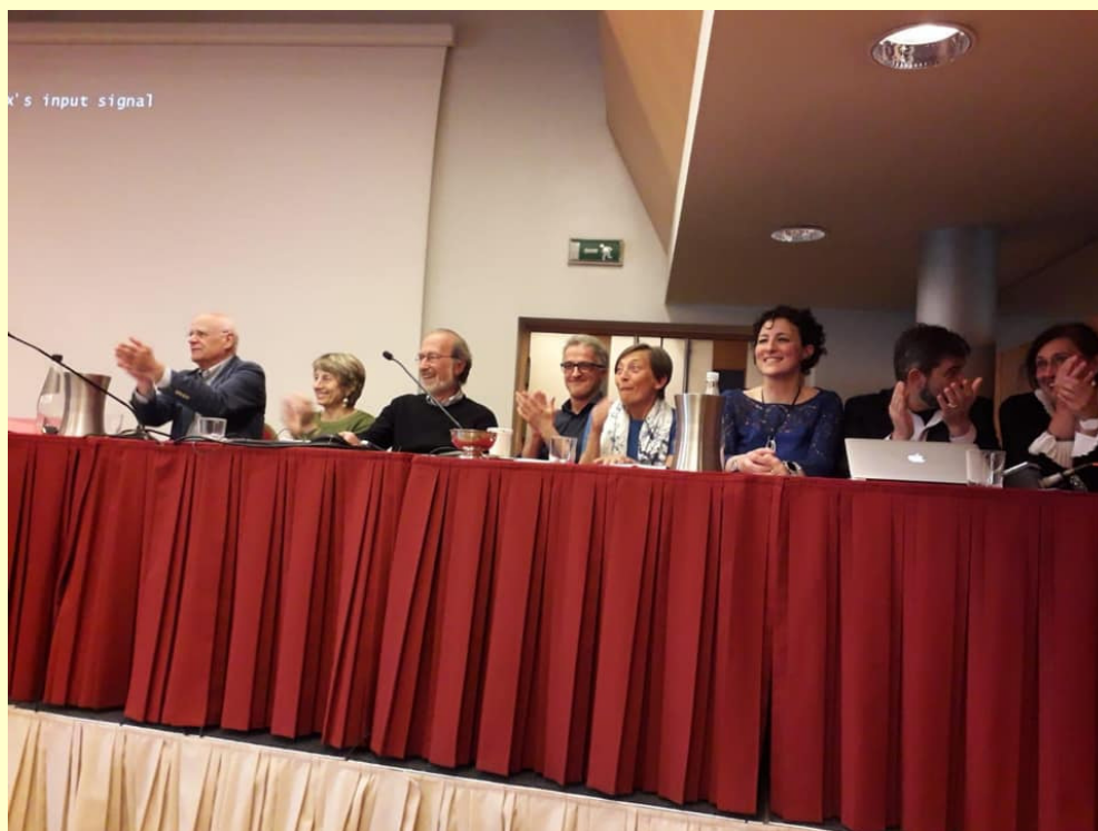
Relatori prima giornata, dibattito con la sala