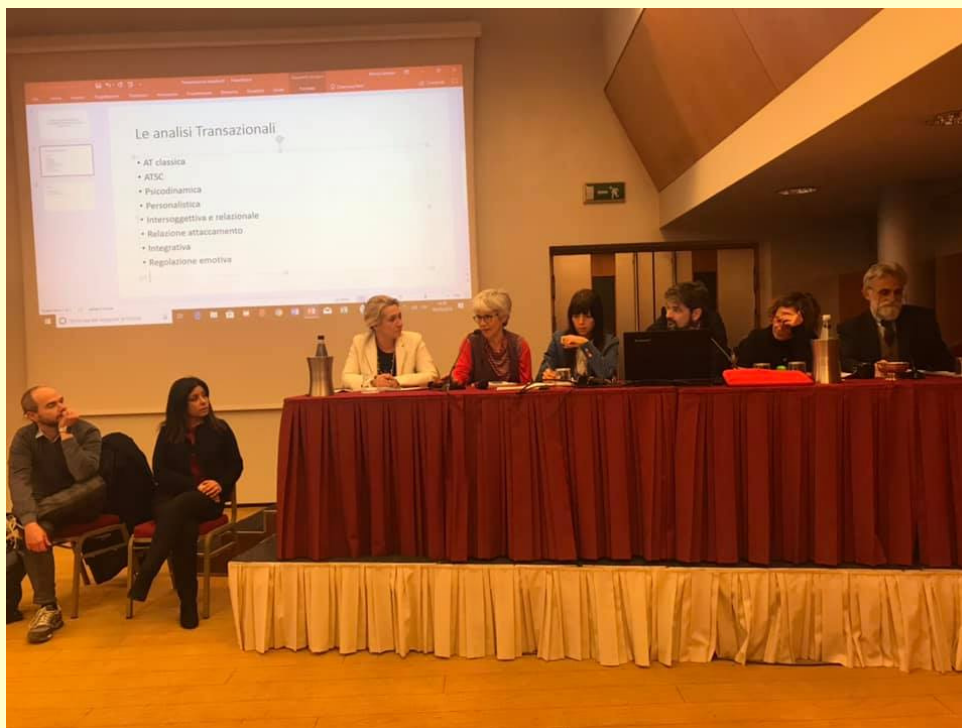
Tavola rotonda seconda giornata, incontro e discussione tra AIAT ed esponenti di altre associazioni AT