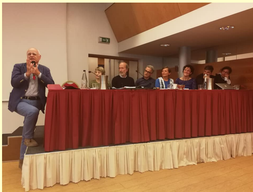
Relatori prima giornata, dibattito con la sala